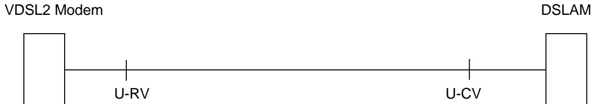
Abbildung 2.3.1 Schematische Darstellung eines VDSL2 FTTC Anschluss